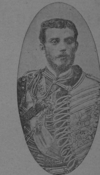
DON ANTONIO DE ORLEANS