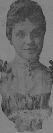
DONA EULALIA DE ORLEANS

LONDRES, 18.—Ha sido muy comentado que los infantes Antonio de Orleans y su esposa Eulalia, hayan solicitado nacionalizarse en Francia. El asunto no se ha resuelto y se ha comunicado á España. La petición obsequia á Illinois; se la principiará a renovar, porque de conformidad con la ley española el Gobierno lo impediría.